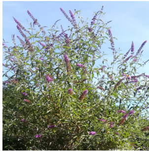
Buddleia "Arbre à papillons"