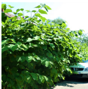
Renouée du Japon