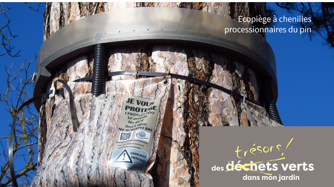
Écopiège à chenilles processionnaires du pin

trésors! des déchets verts dans mon jardin