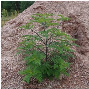
Ambrosie à feuilles d'armoise

Les EEE sont répertoriées dans des listes régionales ou territoriales. Parmi elles, voici quelques exemples d'EEE que vous pouvez retrouver dans vos jardins :