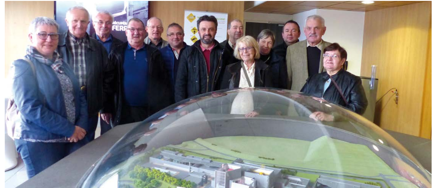
Visite du pôle de valorisation Vernéa par le conseil municipal de Besse et St-Anastaise en 2016