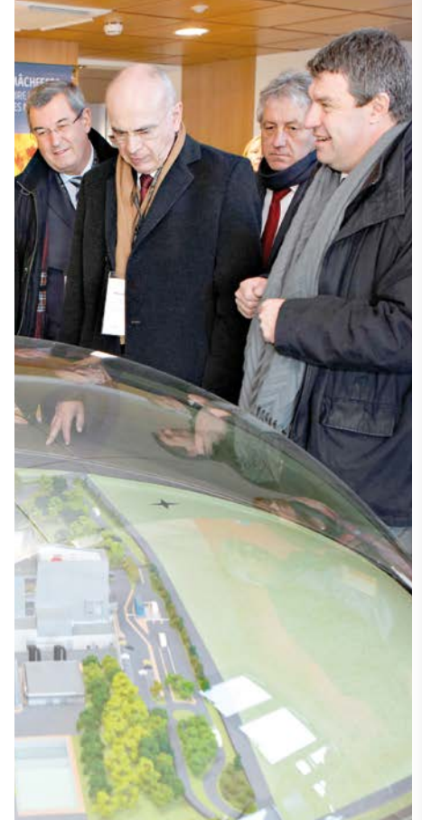
Inauguration du pôle Vernéa en présence du Préfet de la région Auvergne

20 ans d'initiatives innovantes au service exclusif des usagers du service public de gestion des déchets ménagers et assimilés ! Et ce n'est pas fini !