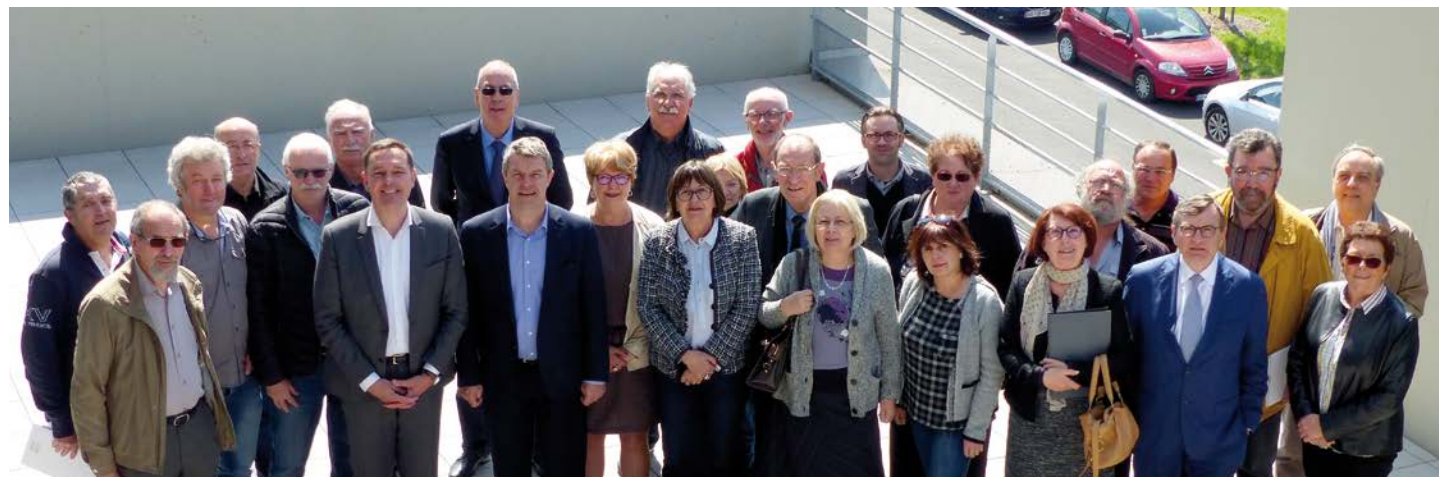
Les élus du VALTOM en 2017