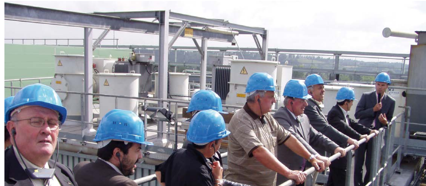
Visite de l'Unité de Valorisation Énergétique de Bègles en 2005

Le VALTOM a donc été créé en janvier 1997. Les présidents des syndicats les plus importants du Puy-de-Dôme, Clermont Communauté et Syndicat du Bois de l'Aumône, n'ont pas souhaité en assurer la présidence et ont sollicité ma candidature en ma qualité de Président du SICTOM des Couzes ; je représentais un syndicat rural ce qui rassurait les élus des autres « petits syndicats ».