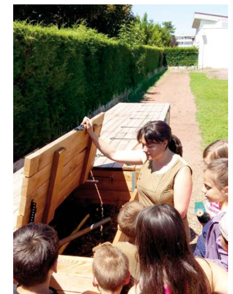
Education à l'environnement

Les collectivités ont progressivement investi la prévention des déchets notamment à travers le développement d'actions pour encourager le compostage domestique, favoriser le réemploi des objets apportés en déchèteries et, plus récemment, pour lutter contre le gaspillage alimentaire. On peut dire aujourd'hui que la prévention des déchets constitue un domaine d'actions à part entière des collectivités pour lequel elles ont un rôle essentiel à jouer. Elles doivent en effet mettre en œuvre un programme local de prévention des déchets pour susciter et coordonner les actions de prévention des différents acteurs de leur territoire.