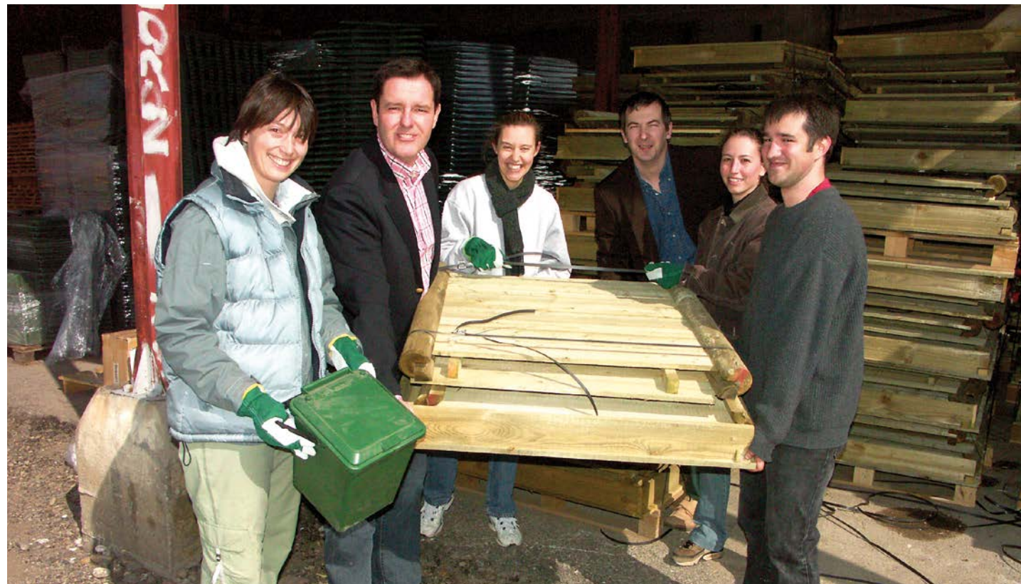
Distribution de composteurs individuels de jardin - Le Cendre 2006