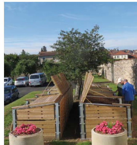
Compostage de grande capacité à l'hôpital d'Ambert.

L'union faisant la force, l'association Conseil départemental/VALTOM/ADEME a permis de mettre en œuvre les moyens humains, financiers et techniques indispensables à l'impulsion d'une dynamique de changement.