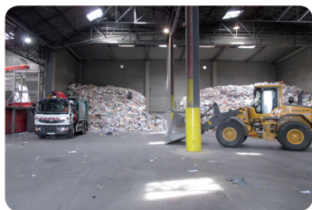
Quai de déchargement