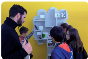
Salle de commande et déchèterie