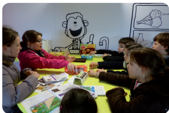
La maison éco-responsible

Infos pratiques : parcours en extérieur , (se renseigner sur les dates proposées)