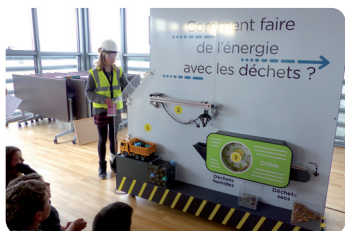
Atelier valorisation énergétique