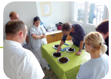
Formation du personnel de cuisine par un maître composteur à l'école d'Aulnat