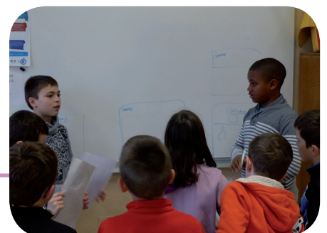
Les CM2 de l'école de Vertolaye, forment les plus petits à l'utilisation du composteur scolaire