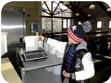
Pesée des déchets de cuisine à l'école d'Ambert