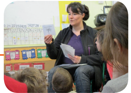
Ateliers de sensibilisation avec une animatrice environnement