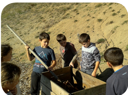
Les élèves de l'école d'Aydat brassant leur compost